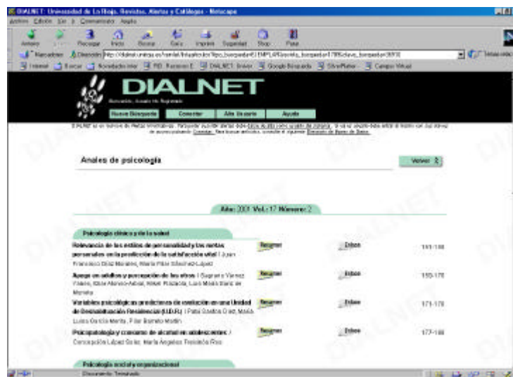
Fig. 4. Imagen del sumario de un ejemplar de una revista, incluyendo los artículos en secciones y ofreciendo resúmenes y enlaces al texto completo.