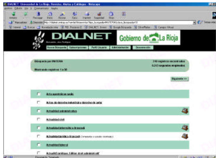
Fig. 2. Listado de revistas. Sistema personalizado para cada Biblioteca, con posibilidad para el usuario de suscribirse a todas las revistas.