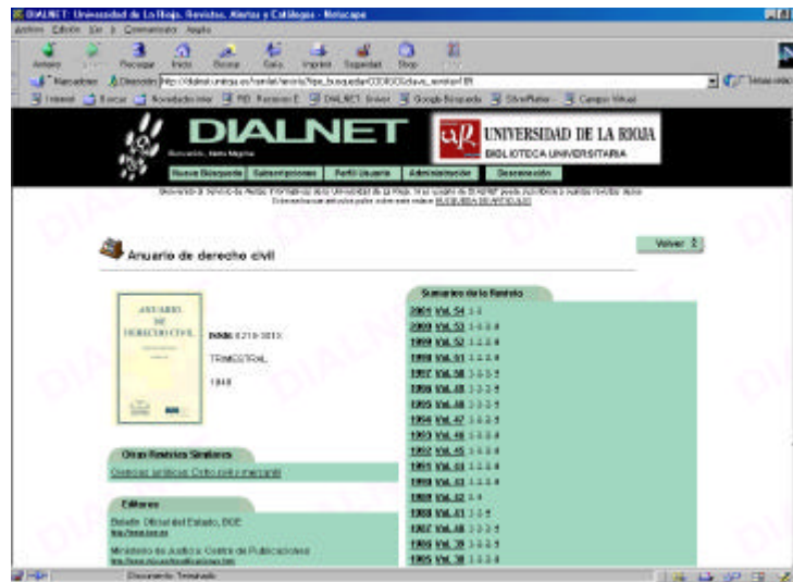
Fig. 3. Imagen de una revista. Datos bibliográficos y sumarios.